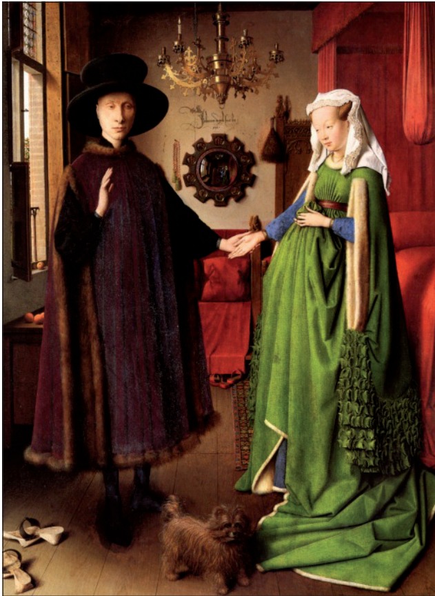
Jan van Eyck (1390–1441): Soții Arnolfini (1434), National Gallery, Londra