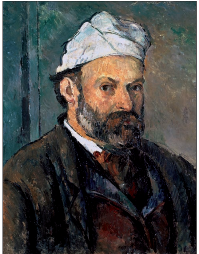
Paul Cézanne (1839–1906): Autoportret (1877–1879), Neue Pinakothek, München