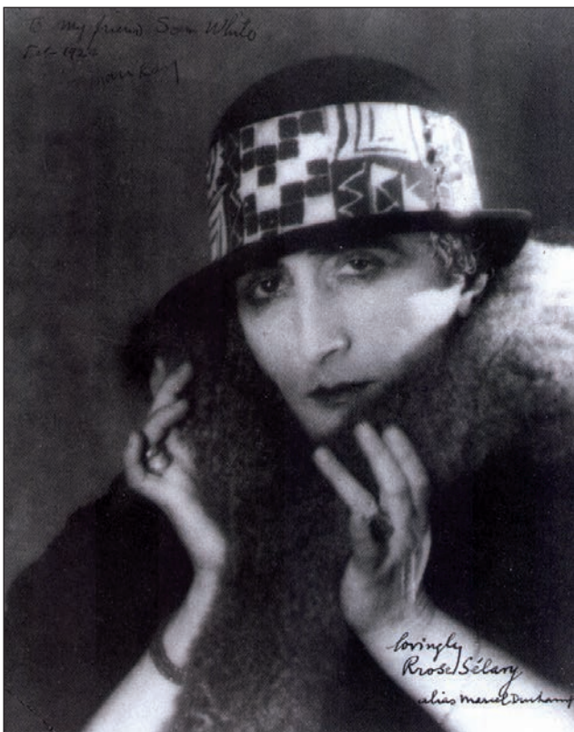
Marcel Duchamp (1887–1968); Duchamp dându-se drept Rose Sélavy (1920). Persoana reală este înlocuită de o persoană fictivă. În portret apar jocuri de cuvinte și de identități