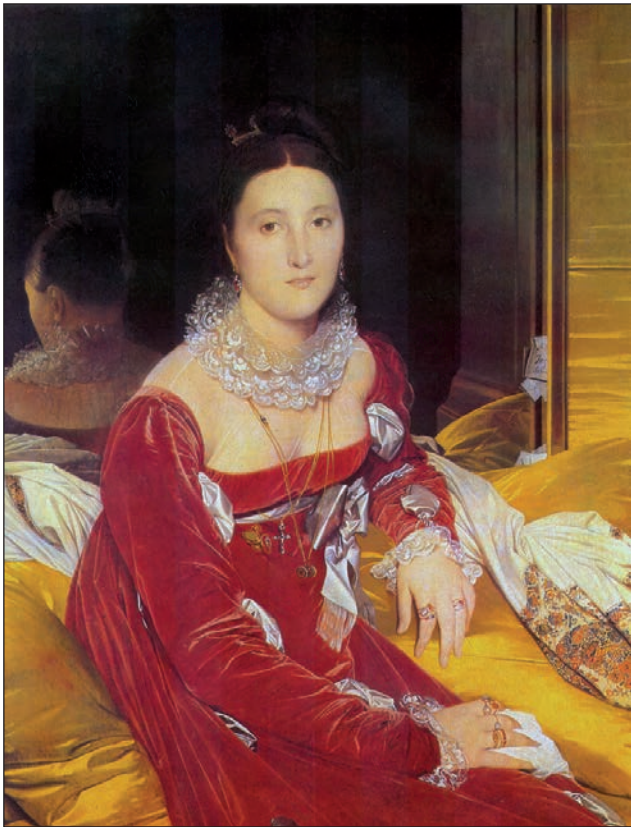
Dominique Ingres (1780–1867): Portretul Doamnei de Senonnes (1814), Musée des Beaux-Arts