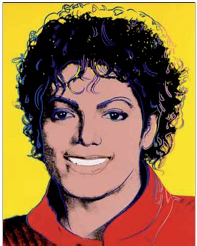
Andy Warhol (1928–1987): Michael Jackson (1984). Vedeta pop este tratată ca un obiect ready-made, depersonalizată, ca „un produs”, un obiect al societății de consum