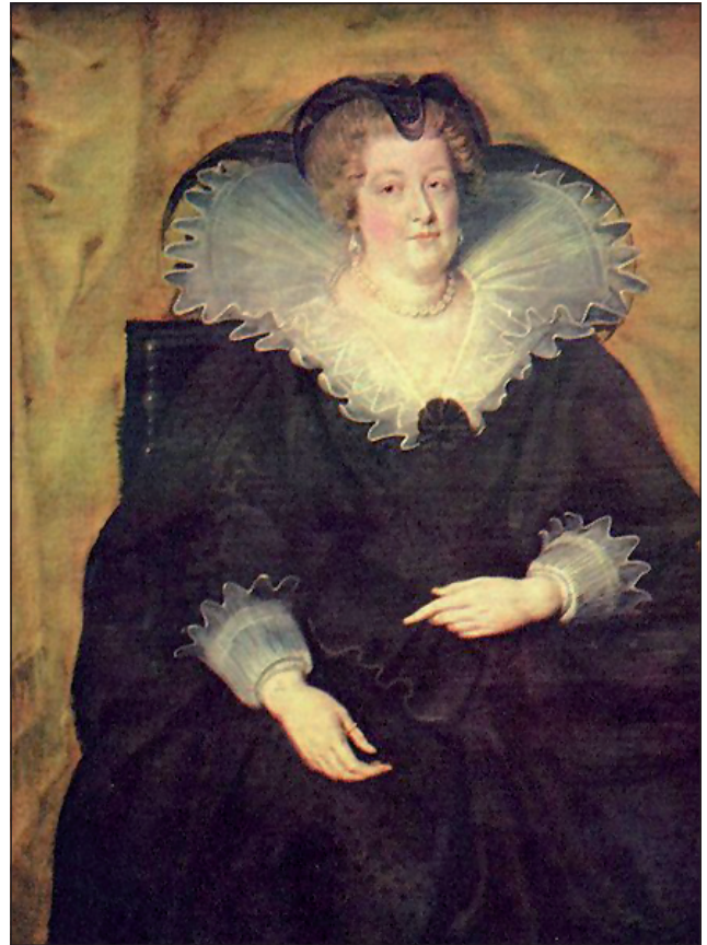
Pieter Paul Rubens (1577–1640): Maria de Medici, Regina Franței (1625), Museo Prado, Madrid

litate la Florența în timpul Renașterii. Apar portretele din profil, de tip medalion, asemenea portretelor de pe monede. Astfel putem vedea portretele familiilor nobiliare înconjurate de atmosfera calmă a peisajelor din Toscana, reprezentate în fundal (Pierro della Francesca, circa 1420–1492). Artiștii Renașterii erau familiarizați cu anatomia sau filozofia, acestea influențându-le gândirea și opera.