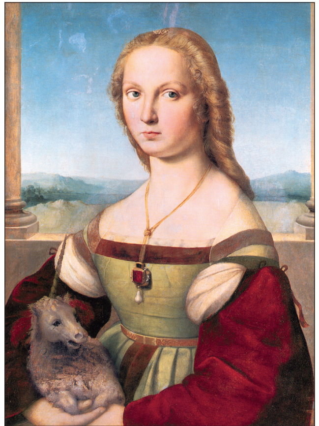
Raffael (1483–1520): Doamna cu unicornul (1505–1506), Galleria Borghese, Roma