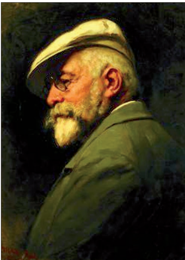
Benczúr Gyula (1844–1920): Autoportret (1917), Galleria Uffizi, Florența

trete remarcabile. În Italia și Germania, cerința de redare cât mai fidelă a chipului – devenită o modă națională – sporește rolul portretisticii. În Perioada barocă s-au remarcat, prin portretele realizate, trei mari pictori: Velazquez (1599–1660), Rembrandt (1606–1669) și Rubens (1557–1640). În portretele tratate realist se exprimă starea sufletească, trăsături alegorice, gesturi dinamice și expresive. Anthonis van Dyck (1599–1641), care a fost elevul lui Rubens, a pus în evidență în picturile sale starea de mulțumire și eleganța aristocratică ale modelelor sale. După Revoluția Franceză temele devin mai realiste, mai simple, mai aproape de problemele sociale ale oamenilor de rând.