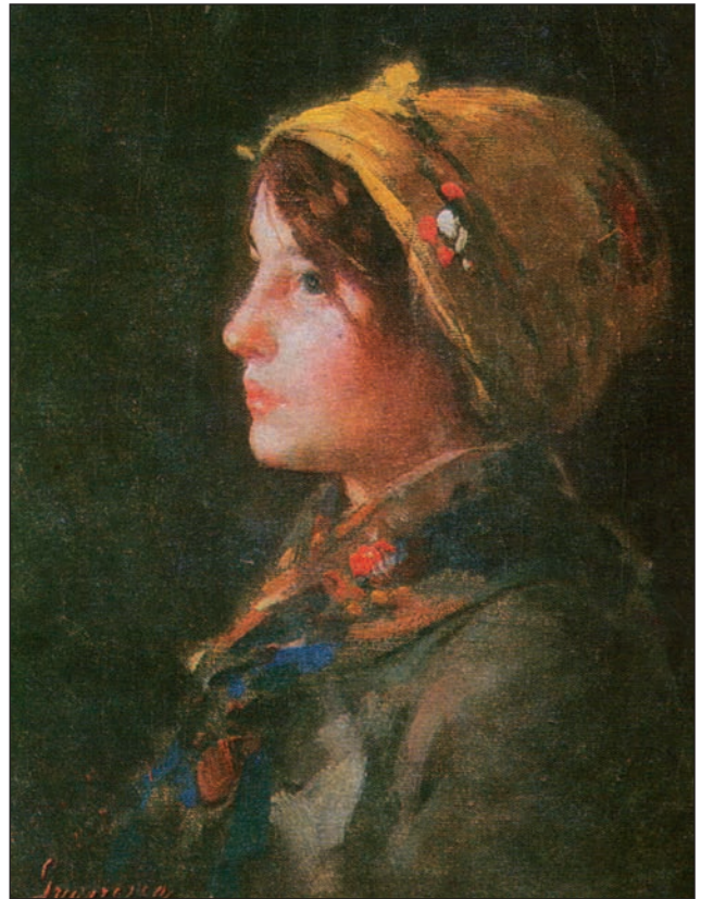
Nicolae Grigorescu (1838–1907): Profil de fată (1878)