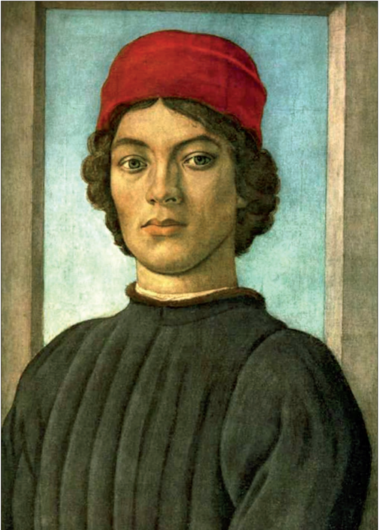
Filippino Lippi (1457–1504): Portret de bărbat tânăr; se presupune că ar fi portretul lui Burchiello (1478), Paris, Louvre. Lucrarea i-a fost atribuită lui Botticelli