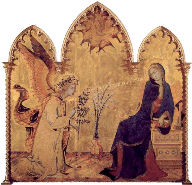
Simone Martini (1284–1344): Bunavestire (1333), Galleria Uffizi, Florența