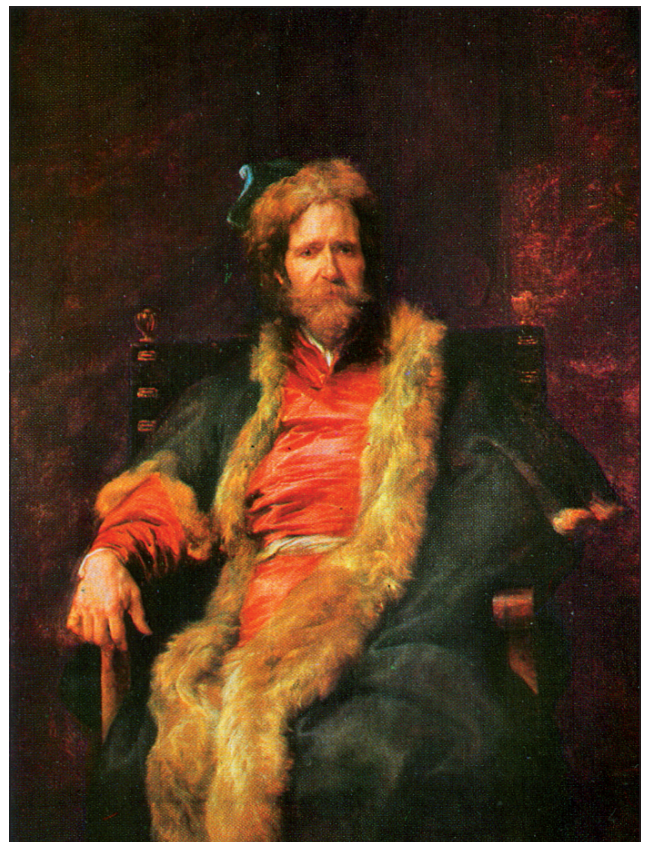
Anthonis van Dyck (1599–1641): Martin Ryckaert, pictorul fără o mână (Museo Prado, Madrid)

Cei doi artiști remarcabili ai picturii flamande, Jan van Eyck (1390–1441) și Pieter Paul Rubens (1577–1640), au influențat pictura germană din sec. XVII, care a fost dominată de portrete realiste. Unul dintre cei mai mari maeștri ai Renașterii, Albrecht Dürer (1471–1528), a realizat por-