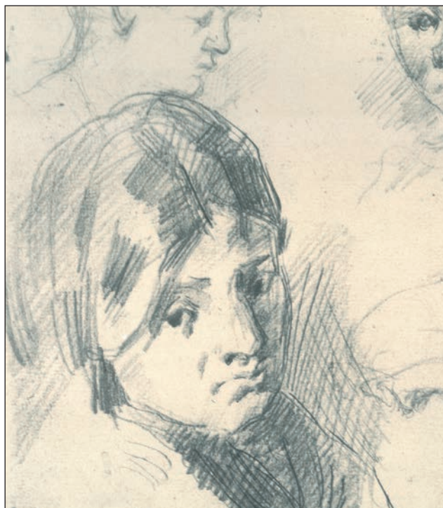
Cézanne: Studiu, detaliu (22 × 28 cm)

Dorința de a desena frumos este firească pentru oricine, indiferent de vârstă. În cartea noastră ne propunem să studiem o ramură mai veche a desenului: desenul de portret. Portretul se ocupă cu reprezentarea trăsăturilor feței umane, dar și a trăirilor interioare, de la dorințele ascunse ale copilăriei până la mărturiile confesional-suprealiste. Cea mai importantă particularitate a desenului este relația de reciprocitate dintre artist și modelul său. Este o relație de intimitate creativă și constructivă bazată pe personalitățile lor.