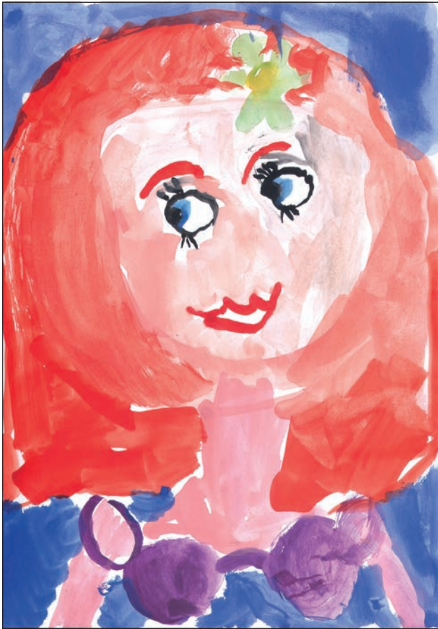
Acuarelă realizată de o fetiță de 7 ani

Portretistica este o formă de învățare, de cunoaștere a formelor lumii înconjurătoare; este un proces care duce la formarea personalității și la vizualizarea stărilor sufletești. Oricât ar părea de ciudat, fiecare dintre noi învață să deseneze în felul său particular. Nu suntem în măsură să dăm o rețetă universal-valabilă, dar putem dobândi cunoștințe de specialitate despre bazele desenului, materialele de lucru și modul lor de întrebuințare, ne putem însuși câteva noțiuni de anatomie artistică, suficiente pentru ca folosindu-le drept suport să putem realiza portrete și să ne dezvoltăm aptitudinile artistice.