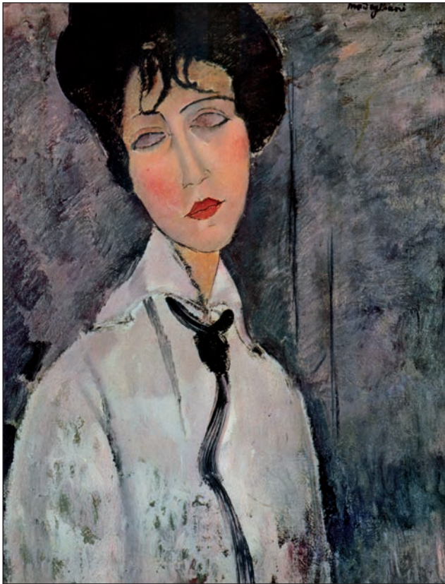
Amadeo Modigliani (1884–1920): Femeie cu cravată neagră, Paris (proprietate particulară)